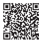
Verbandsinformationen AM Suisse