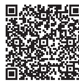
Organigramm AM Suisse

Thomas Teuscher im Namen des Vorstandes Agrotec Suisse