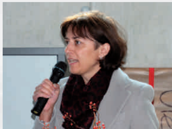
Regierungsrätin Monika Knill: Der «Kanton der kurzen Wege» gewährt gute Rahmenbedingungen für gute Ausbildung.

Mit der Inbetriebnahme des Ausbildungszentrums «LMB Technik + Bildung» ist ein Etappenziel erreicht. Den Verantwortlichen ist jedoch klar, dass damit die Zukunft erst begonnen hat – die attraktive Hülle muss jetzt langfristig mit Leben gefüllt werden: mit Lernenden, die sich später weiterbilden wollen, und dank Erträgen durch die Fremdvermietung soll ein Gewinn erreicht werden, welcher wiederum