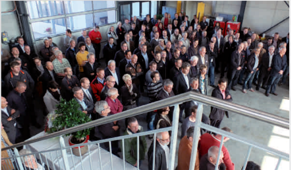
Unterstützung von nah und fern: Besucher an der Eröffnungsfeier.

Le soutien de partout : les visiteurs lors de la cérémonie d'ouverture