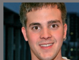
Mettler Remo, Inwil