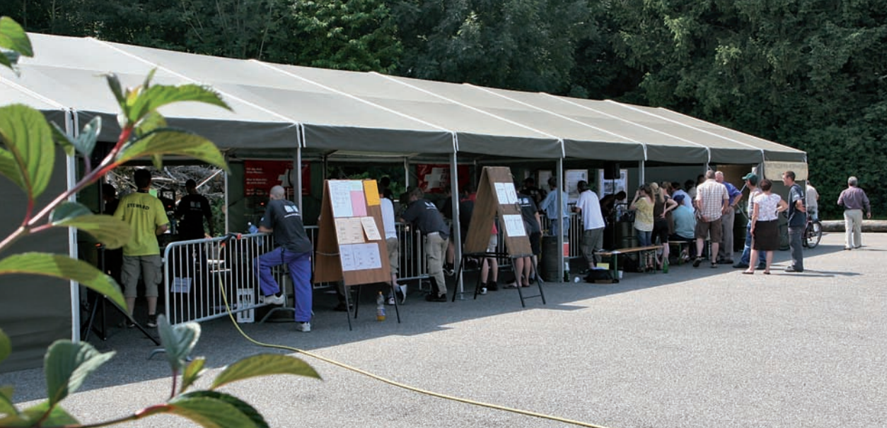
Swiss Skills 2008, maréchaux-ferrants