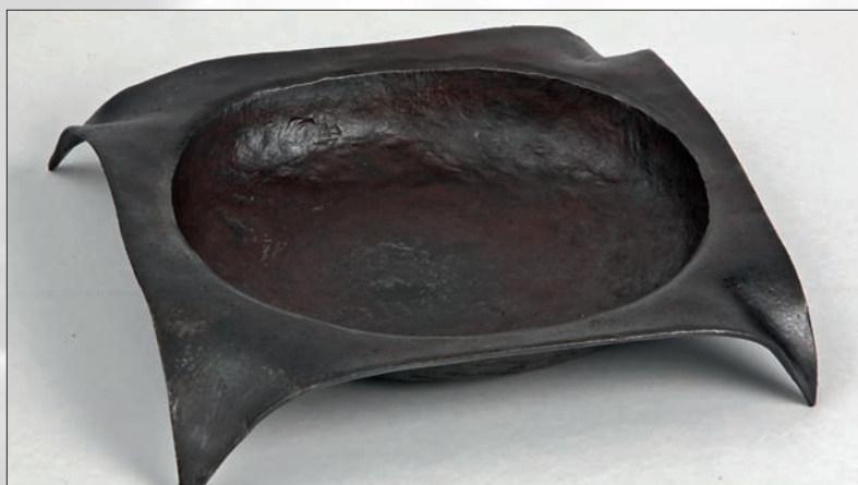
Œuvre de Tobias Herger.

Les objets d'art ont été très appréciés par l'ensemble des visiteurs. Ces pièces seront exposées à différents endroits au cours des 6 prochains mois.