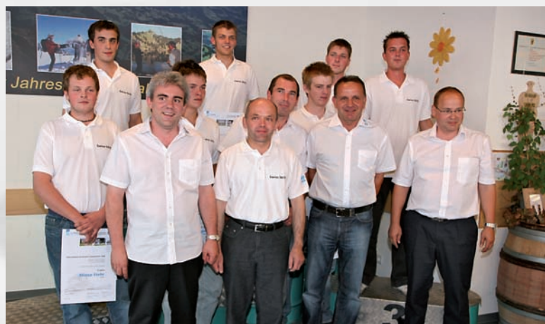
Les participants des CLIMMAR Skill avec les responsables de cet événement.