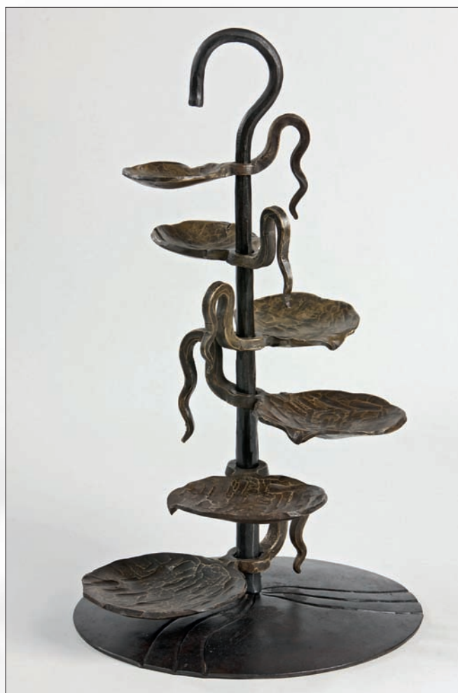
Œuvre de Urs Würsch.